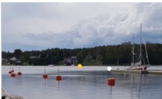
Principbild på Målgång i Mariehamn